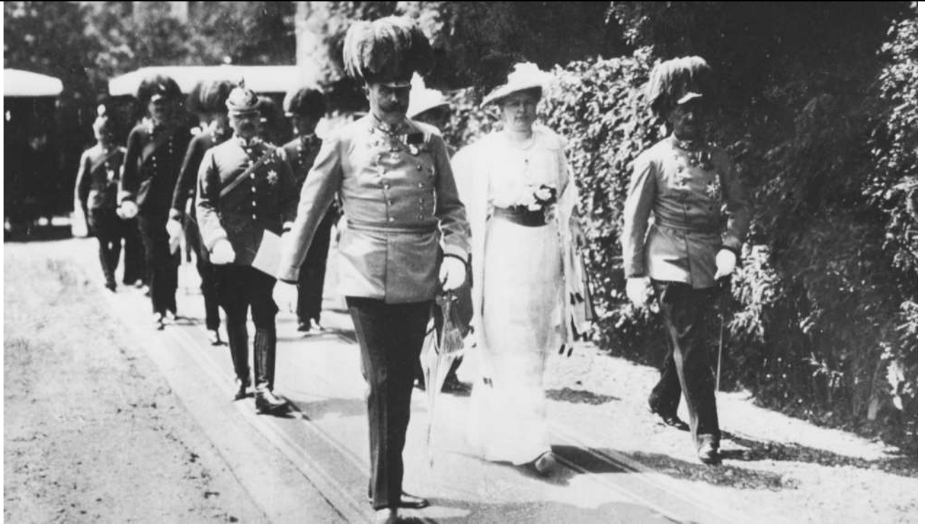
Fig. 5 Il principe ereditario Francesco Ferdinando e la moglie Sofia durante la visita a Sarajevo