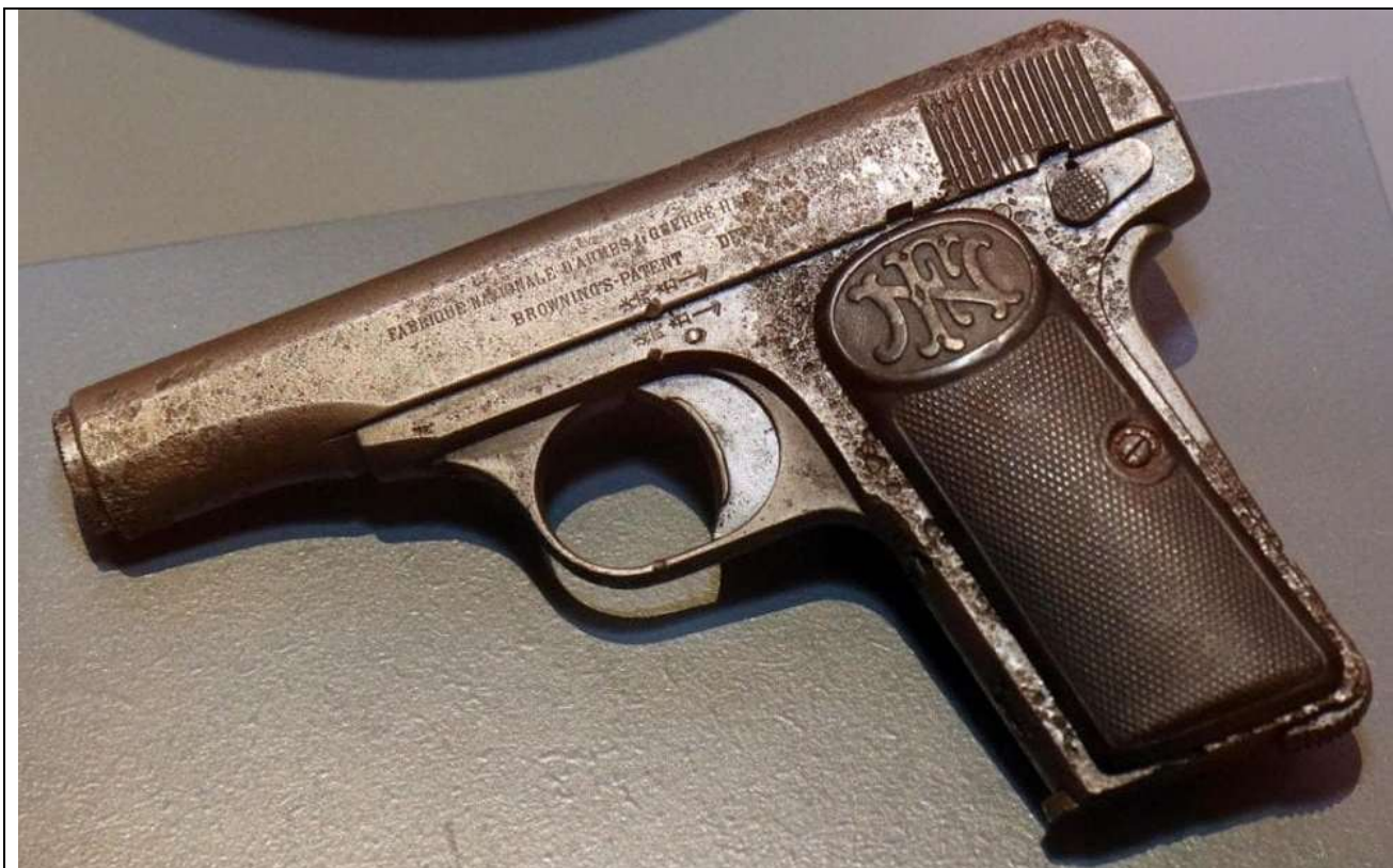
Fig. 16 - L'arma dell'attentato conservata al Museo di storia militare di Vienna