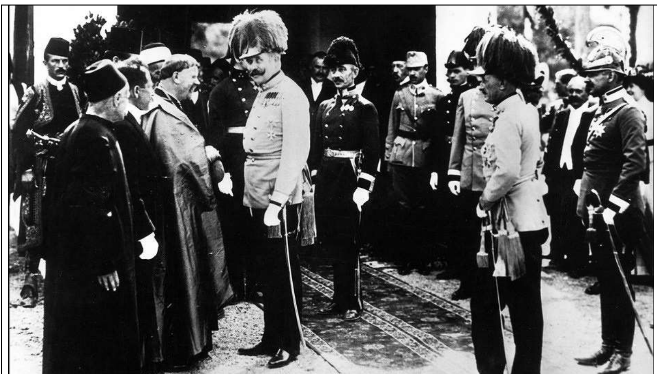
Fig. 4 Il principe ereditario Francesco Ferdinando durante la visita a Sarajevo