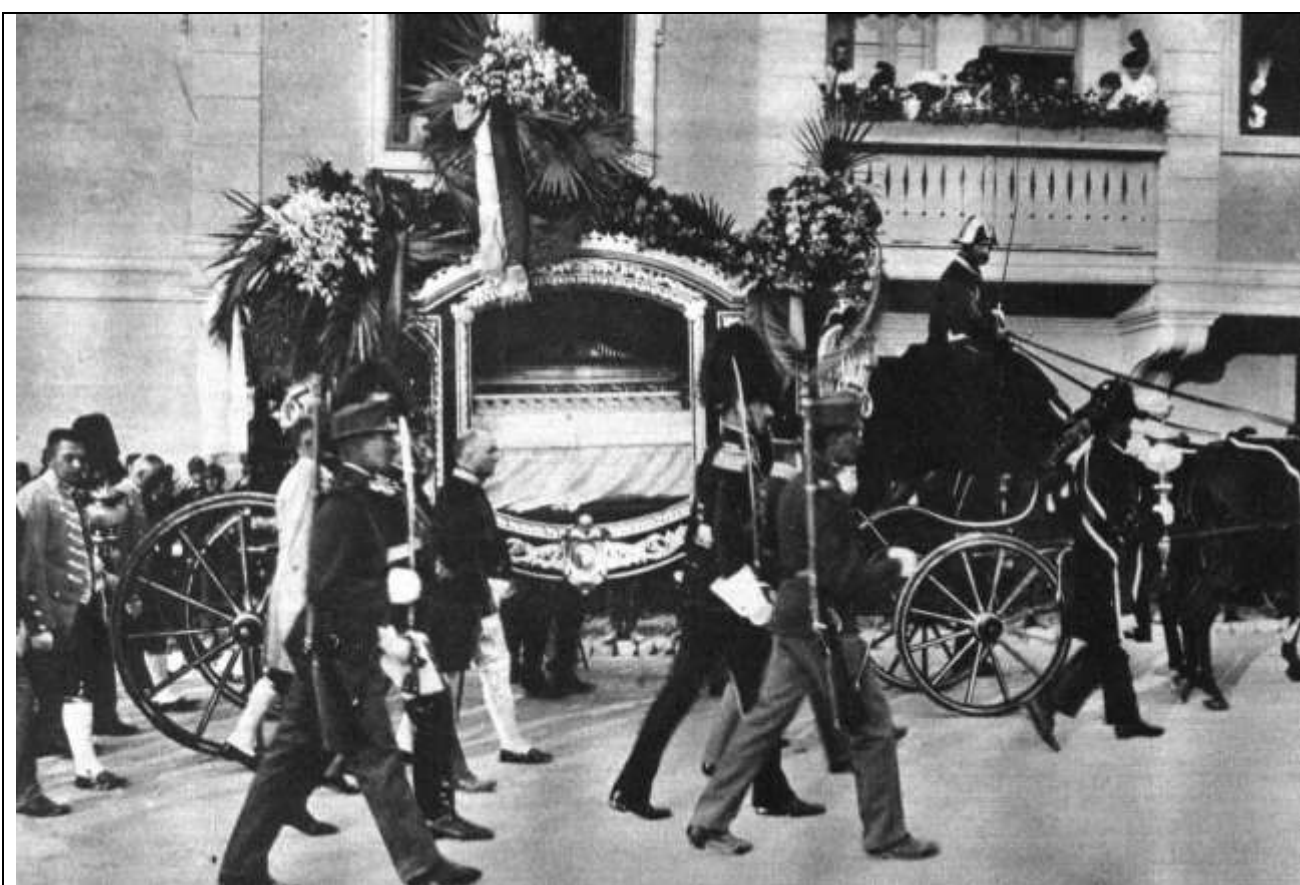
Fig. 19 - Corteo funebre