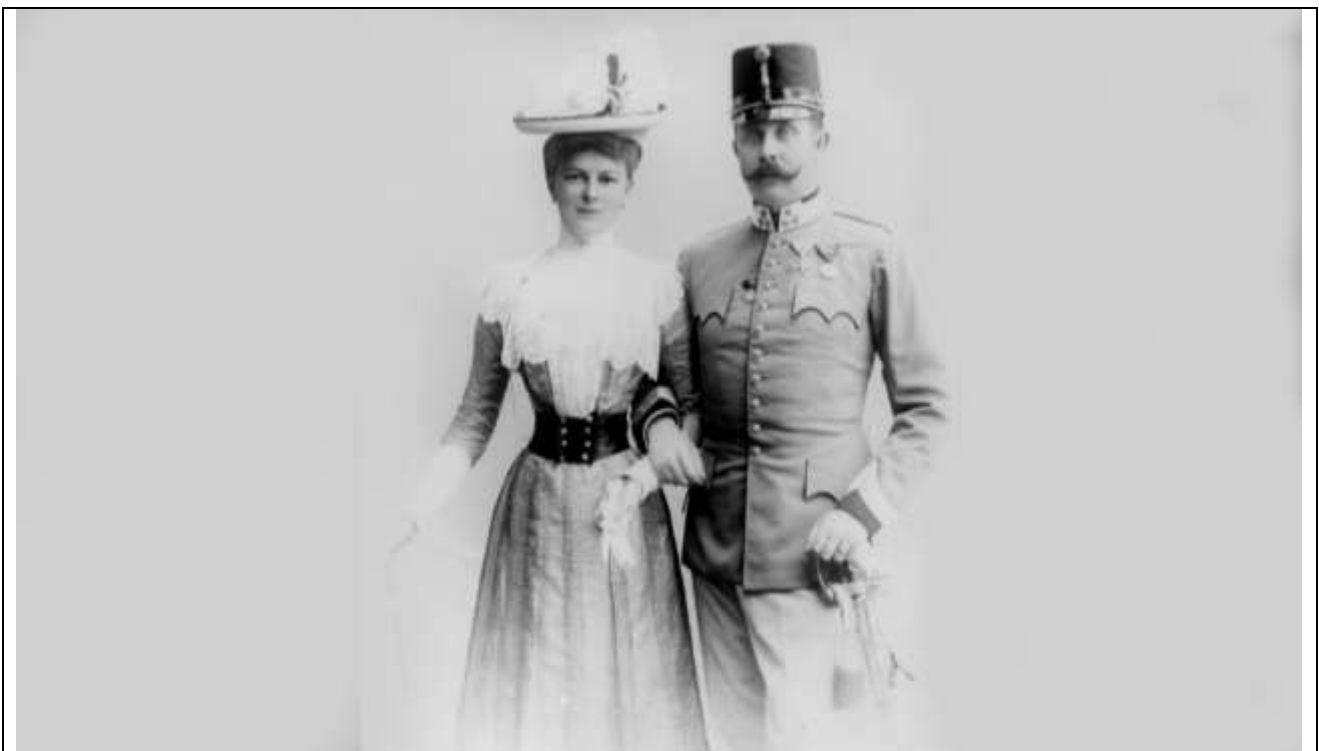
Fig. 2 – Francesco Ferdinando Carlo Luigi Giuseppe d'Austria-Este (in tedesco Franz Ferdinand Karl Ludwig Joseph von Habsburg-Lothringen-Este ) Graz, 18 dicembre 1863 – Sarajevo, 28 giugno 1914). Sofia Chotek von Chotkowa , duchessa di Hohenberg Stoccarda, 1° marzo 1868 – Sarajevo, 28 giugno 1914).