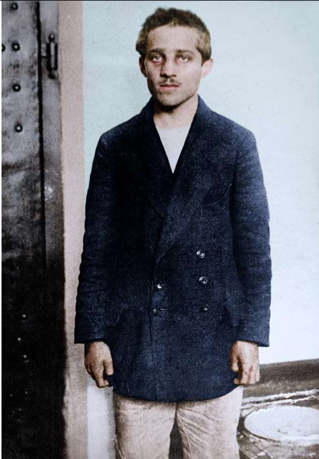
Fig. 12 - Gavrilo Princip il giovane studente responsabile materiale dell'attentato di Sarajevo