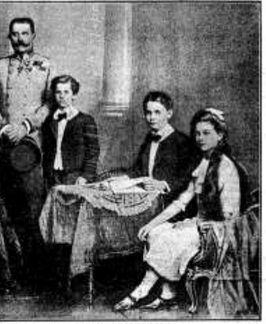
L'Arciduca Ereditario Francesco Ferdinando e la sua famiglia

Il fatto è che l'Arciduca non è stato ucciso, ma ferito. La bomba gli ha colpito il braccio destro, e la moglie è stata colpita al cuore. L'Arciduca è stato trasportato all'ospedale di Graz, dove si trova attualmente. La moglie è stata trasportata all'ospedale di Graz, dove si trova attualmente. Il fatto è che l'Arciduca non è stato ucciso, ma ferito. La bomba gli ha colpito il braccio destro, e la moglie è stata colpita al cuore. L'Arciduca è stato trasportato all'ospedale di Graz, dove si trova attualmente. La moglie è stata trasportata all'ospedale di Graz, dove si trova attualmente.