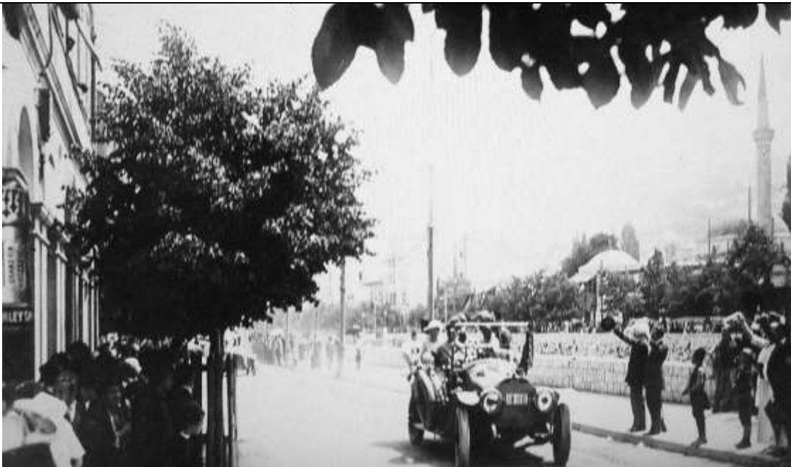
Fig. 8 - Il passaggio della vettura sul lungo fiume pochi secondi prima dell'attentato