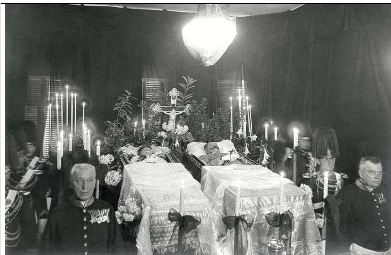
Fig. 20 - Spoglie mortali dell'erede al trono Francesco Ferdinando e di sua moglie Sofia