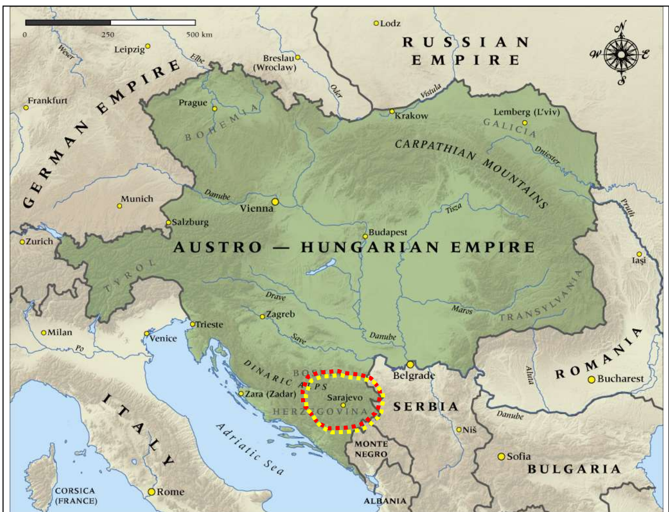
L'impero asburgico nel 1914