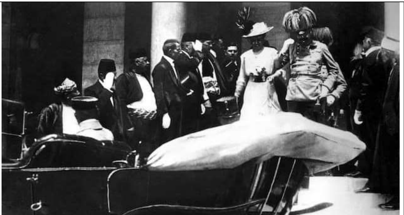
Fig. 6 Il principe ereditario Francesco Ferdinando e la moglie Sofia lasciano il municipio di Sarajevo pochi minuti prima dell'attentato mortale