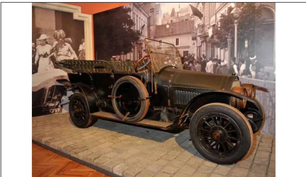
Fig. 17 - La vettura Graf & Stift su cui viaggiava la coppia conservata al Museo di storia militare di Vienna