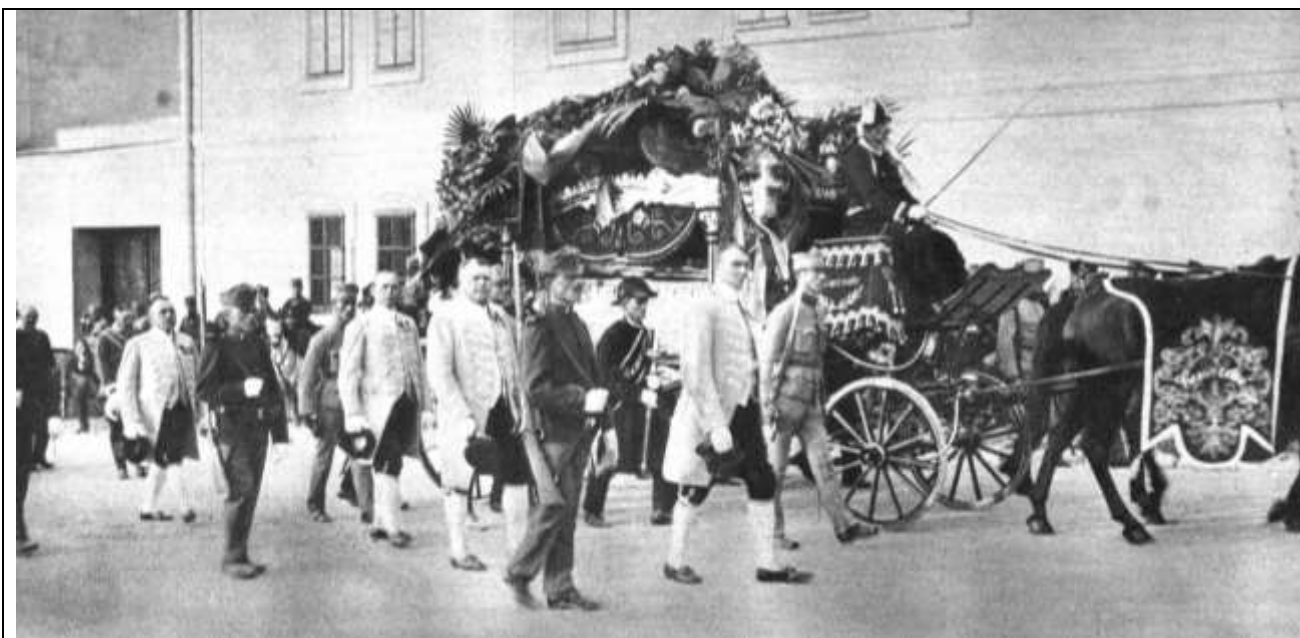
Fig. 18 - Corteo funebre dell'erede al trono d'Austria Francesco Ferdinando