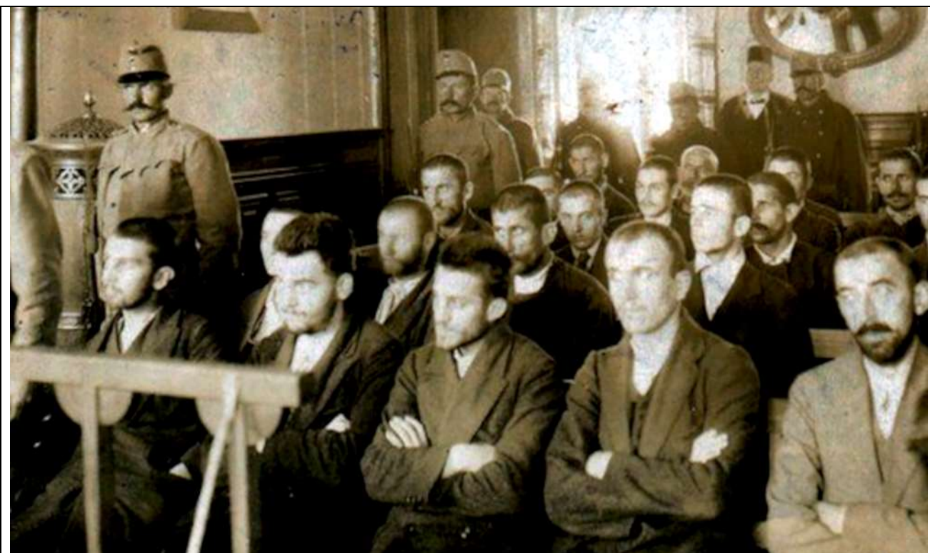
Fig. 11 - Imputati ritenuti responsabili dell'attentato. Tra loro (terzo nella fila) Gavrilo Princip esecutore materiale del duplice omicidio.