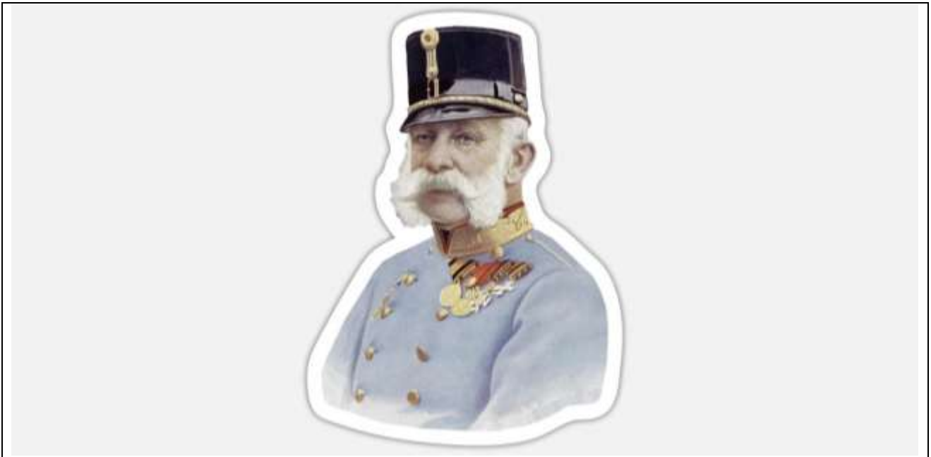
Fig. 1 - Francesco Giuseppe I d'Austria (in tedesco Franz Joseph I. von Österreich ; Vienna, 18 agosto 1830 – Vienna, 21 novembre 1916) è stato un sovrano austriaco. Fu Imperatore d'Austria, Re d'Ungheria, Signore di Trieste e Re di Boemia dal 1848 alla morte; inoltre, dal 1850 al 1866 fu presidente della Confederazione germanica.