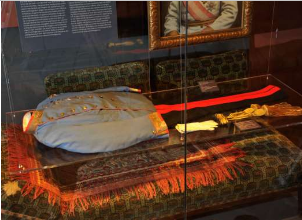
Fig. 22 - L'uniforme insanguinata di Francesco Ferdinando