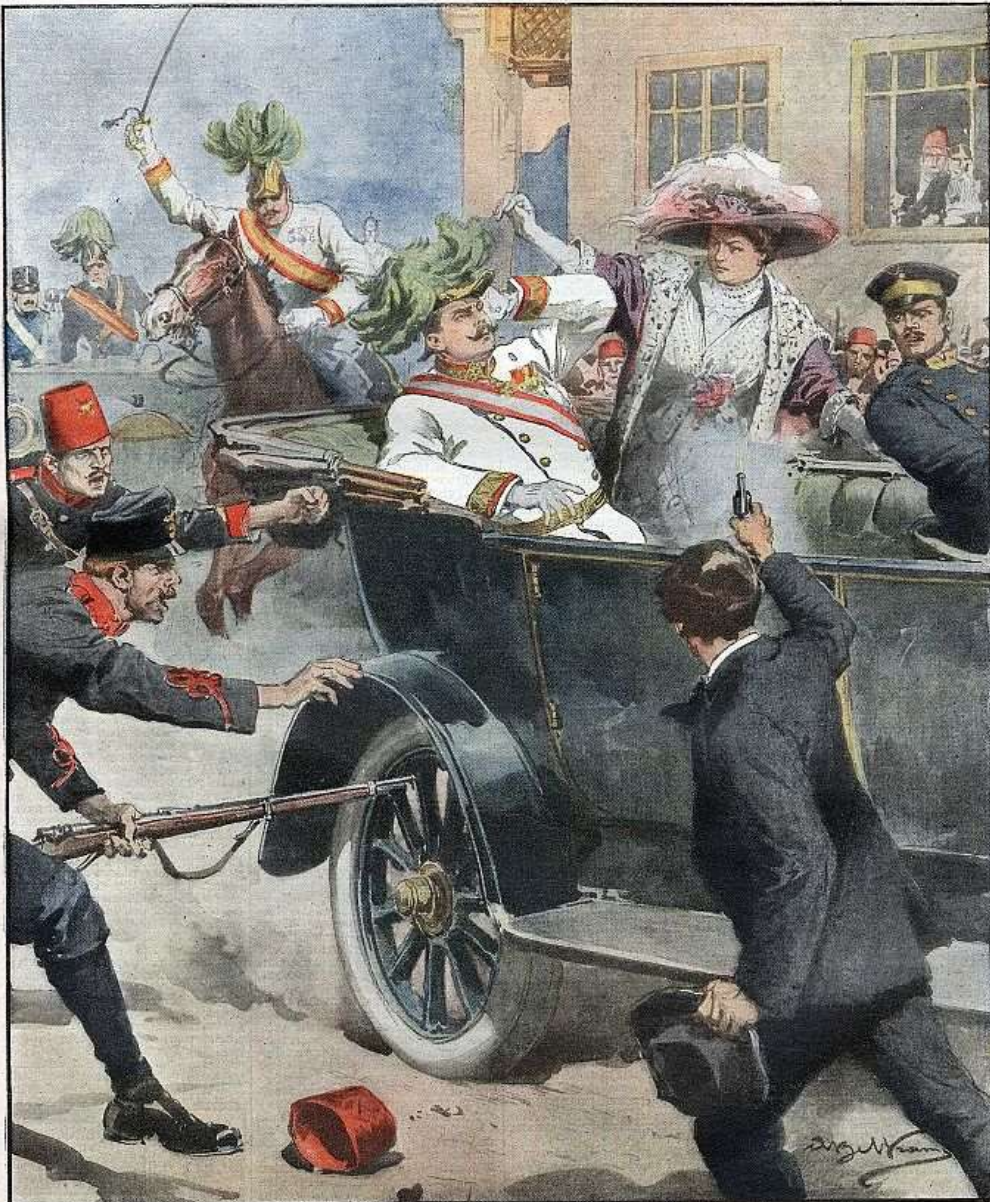
L'assassinio a Serajevo dell'arciduca Francesco Ferdinando erede del trono d'Austria, e di sua moglie. (Disegno di A. Beltrame)

Per tutti gli articoli e illustrazioni è riservata la proprietà letteraria e artistica, secondo le leggi e i trattati internazionali. Anno XVI. - Num. 27. 5 - 12 Luglio 1914. Centesimi 10 il numero.