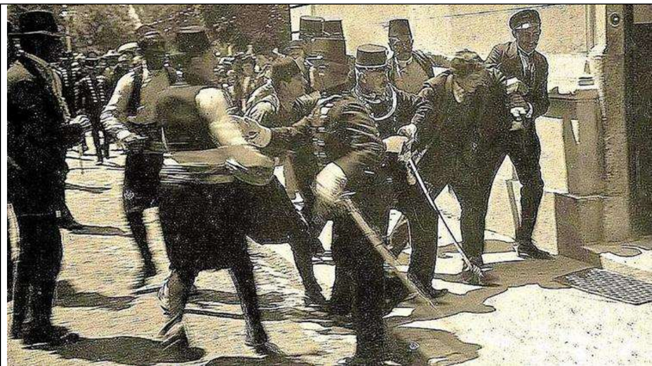
Fig. 10 Arresto del responsabile dell'omicidio dell'erede al trono d'Austria e della moglie