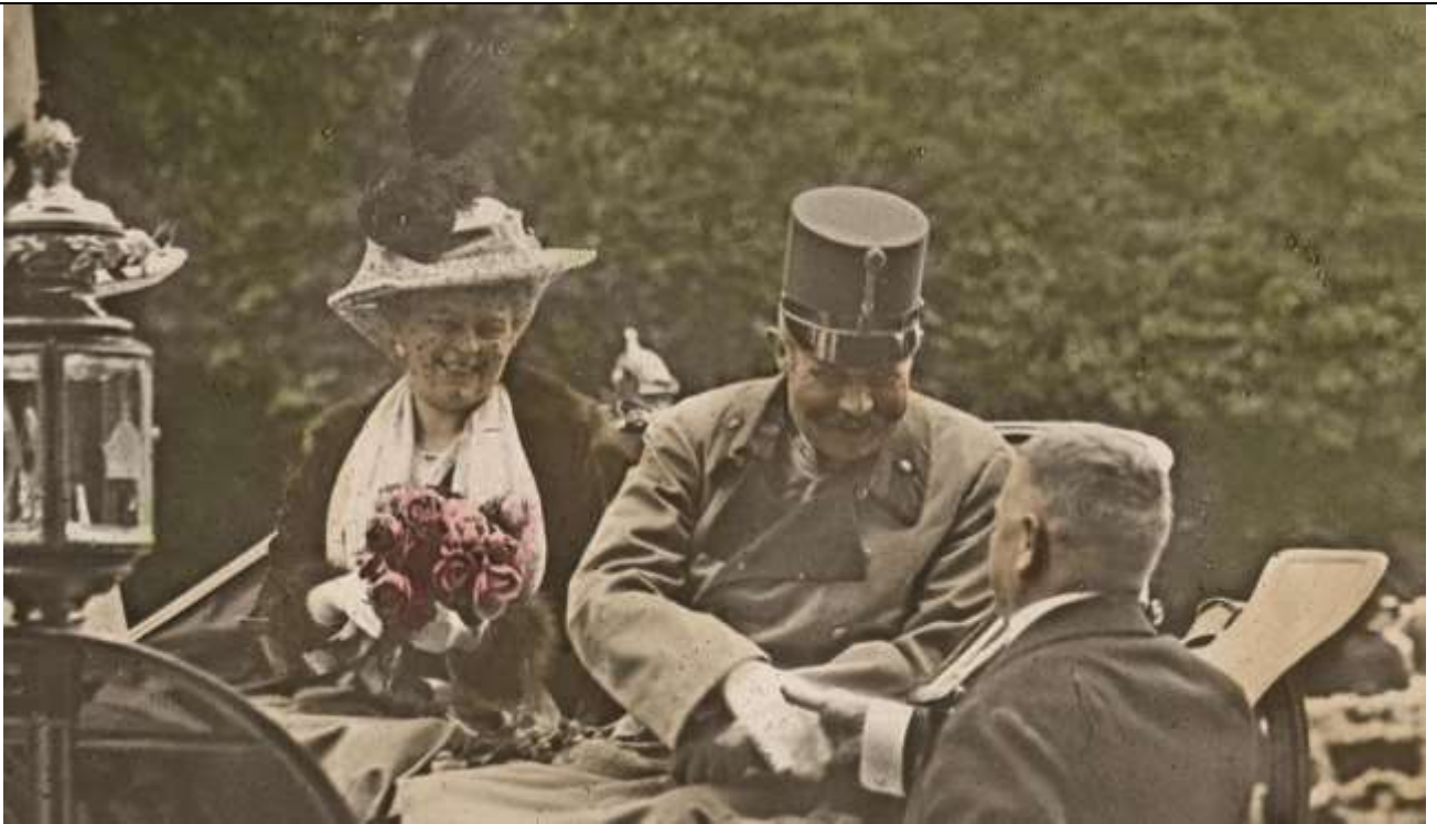
Fig. 7 - Il principe ereditario Francesco Ferdinando e la moglie Sofia durante la loro visita a Sarajevo